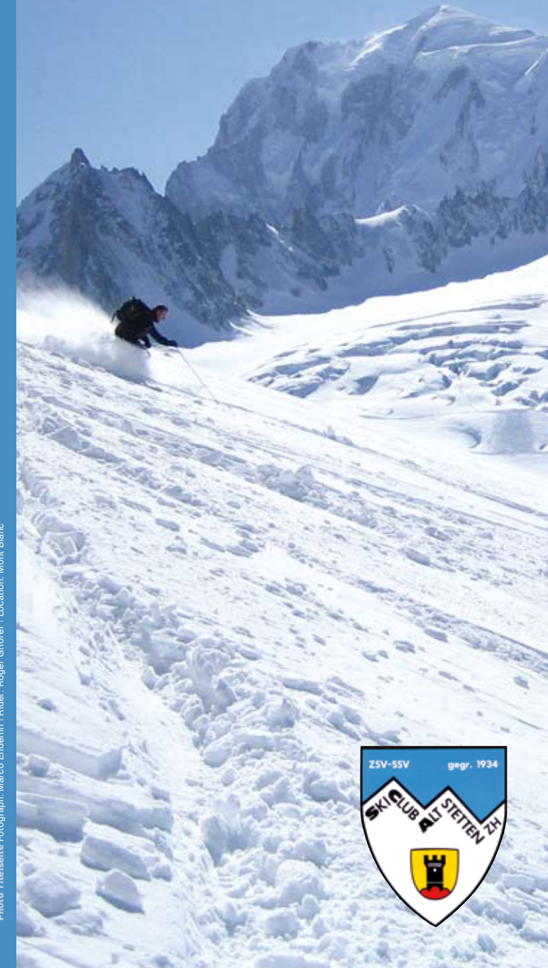
Rider: Roger Gfrörer | Location: Mont Blanc